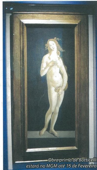
Obra-prima de Botticelli estará no MGM até 16 de Fevereiro

Para além das obras de Botticelli, a exposição inclui também um mini filme de três minutos com pormenores das pinturas de Botticelli. "Focá-